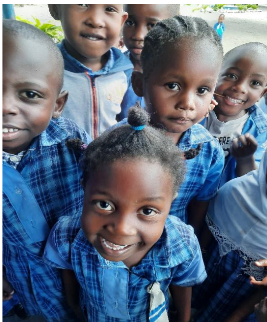
Aanschaf uniformen (jaarlijks)

Tunajenga betaalt deze kosten voor 3 Jongeren op de Primary School, 2 Jongeren op de Secondary School en voor 1 Jongere in het vervolgonderwijs. Ook zijn wij gestart met de sponsorship van 5 kinderen uit een gezin op de Saini Academy waarvan de vader is overleden. De moeder bleef achter met 13 kinderen! Dit maakt het totaal dan van 8 gesponsorde Jongeren op de Primary School