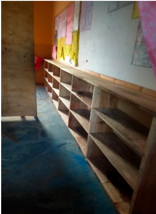
Nieuwe kasten in de lokalen