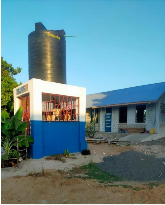
Beveiliging en bescherming van de watertoren