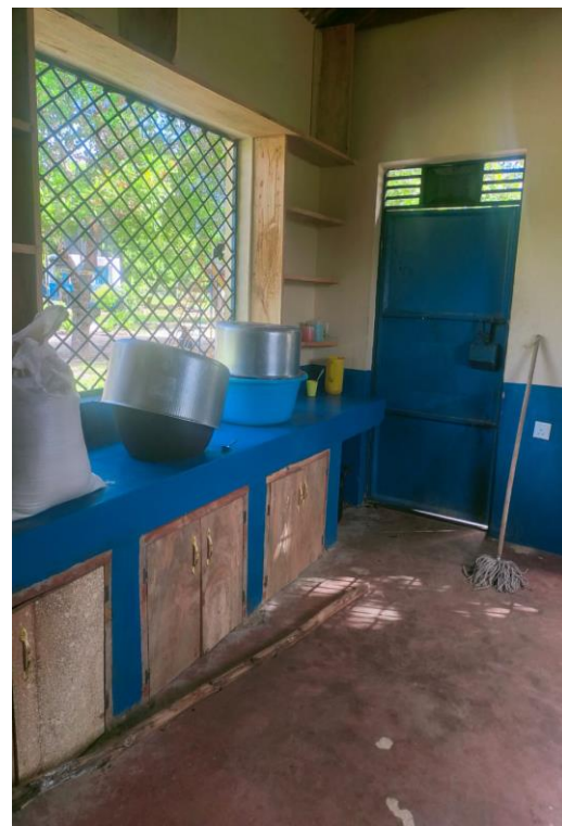
Nieuwe kasten keuken