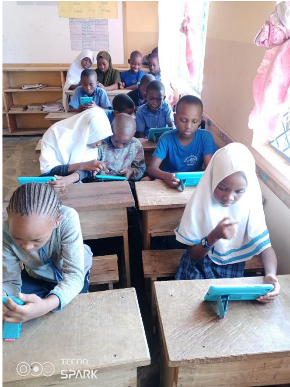
Aanschaf 10 tablets