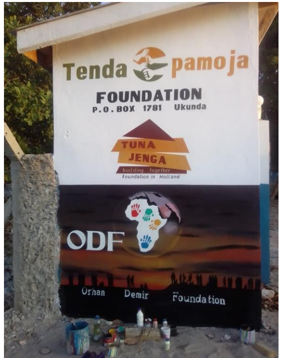
logo's op de muur bij de omheining