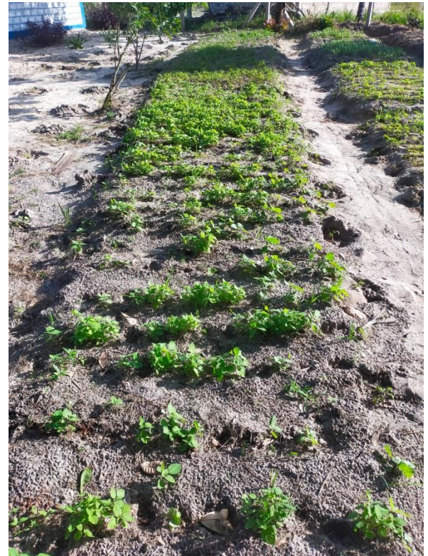
Aanleg groentetuin ( zaden gekocht )

Andere ondersteuningen waren; kleding, baby- en sportkleding voor de Saini Academy Kleding en schoenen voor de gezinnen