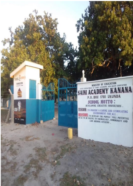
Nieuwe entree van de school