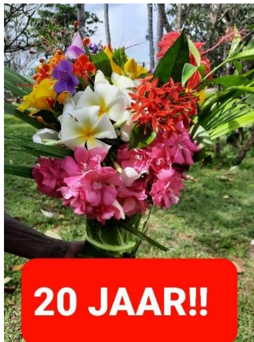
2002-2022 20 jaar activiteiten in Kenia