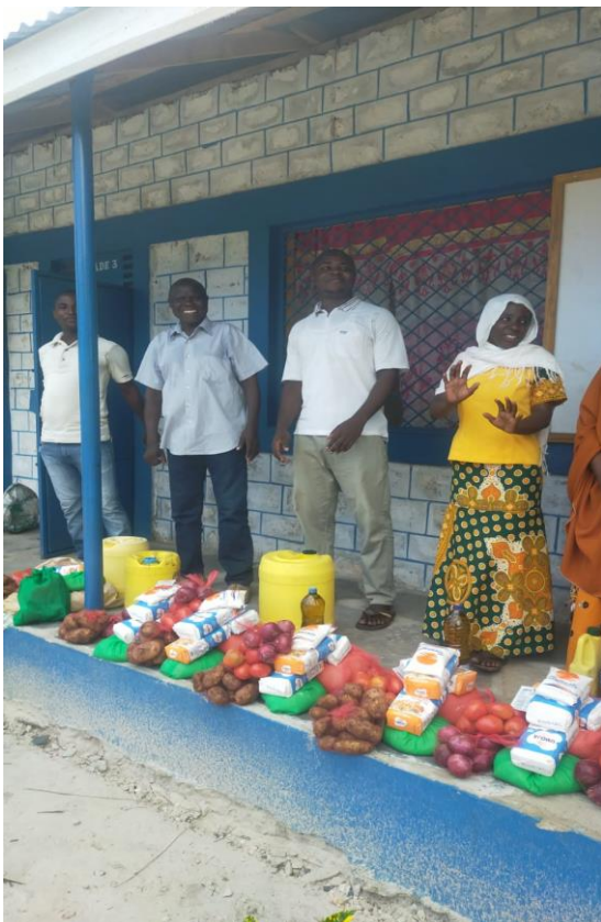
Het team van de Saini met de Kerstpakketten